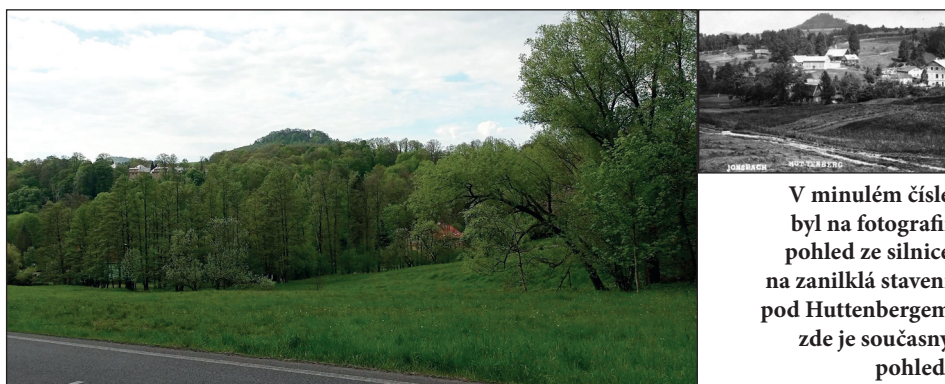
V minulém čísle byl na fotografii pohled ze silnice na zaniklá stavení pod Huttenbergem zde je současný pohled.